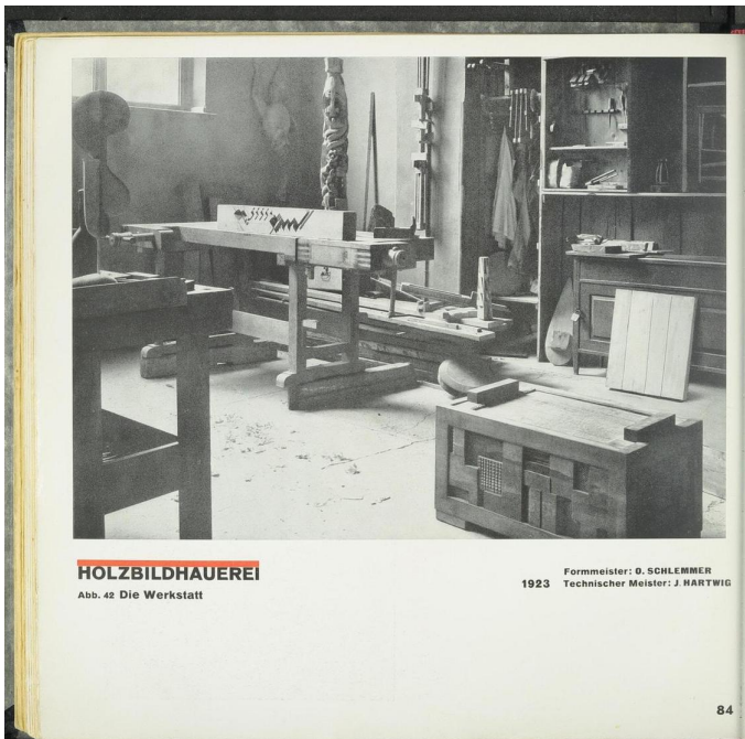
HOLZBILDHAUEREI Abb. 42 Die Werkstatt